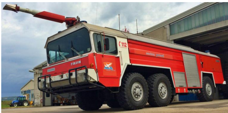
Slika 4: Težko letališko gasilsko vozilo FAUN

Gasilsko vozilo FAUN je težko gasilsko vozilo za intervencije (slika 4). Ima dva motorja DEUTZ F 10 L 413 F z 10 valji, ki je zračno hlajen in ima moč 235 kW (320 KM), avtomatski 3+1-stopenjski menjalnik in pogon na vseh šest koles. Zagotavlja pospeške 80 km/h v 40 s in hitrostjo večjo od 100 km/h. Količina vode je 9.000 l in 1000 litrov penila.