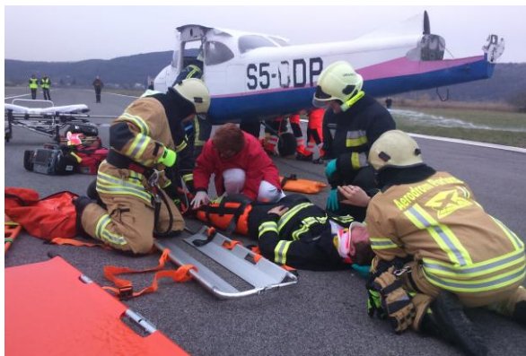
Slika 7: Sodelovanje na vaji

Na vaji so sodelovali gasilsko-reševalne ekipe letališča Portorož (2 vozili), Gasilska Brigada Koper-izpostava Lucija (1 vozilo), PGD Sečovlje (1 vozilo) in PHE Obala (1 vozilo). Vaja je odlično uspela, saj je pokazala dobro pripravljenost gasilcev, ustrezno znanje za posredovanje v tovrstnih nesrečah ter vzorno sodelovanje vseh služb (Slika 7).