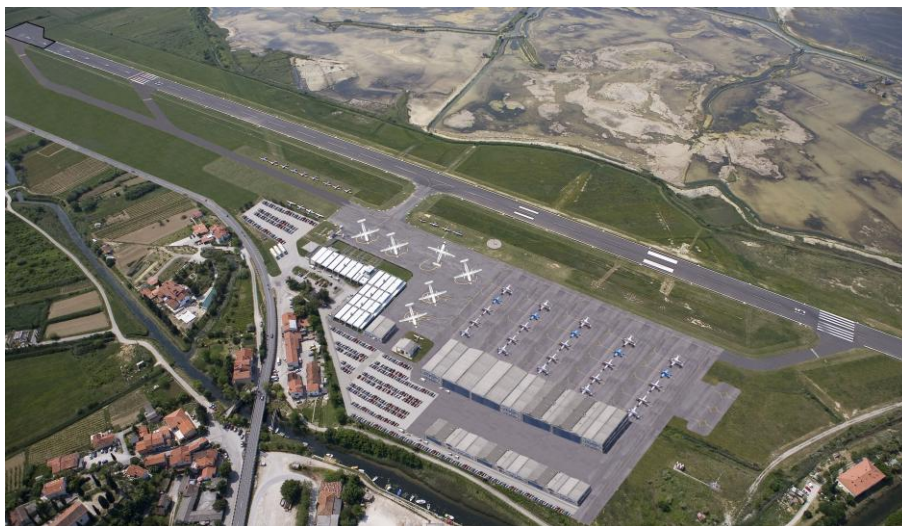
Slika 8: Želje o povečanju letaliških kapacitet

Priprava dokumentacije v zvezi s podaljšanjem vzletno pristajalne steze za 200 m ter obnova ostale infrastrukture je v teku, vendar so postopki zelo dolgotrajni - zelo velika togost slovenske birokracije. S poenostavitvijo postopkov in pridobivanja dovoljenj, bi se omogočil hitrejši razvoj gospodarstva in turizma. Na sliki 8 so prikazane želje povečanja letaliških kapacitet. Letališče Portorož je v sosednjih državah v splošnem letalstvu poznano kot zelo gostoljubno in domače letališče ter - ne glede na svojo majhnost - slovi po zelo profesionalnih storitvah oskrbe potnikov in letal.