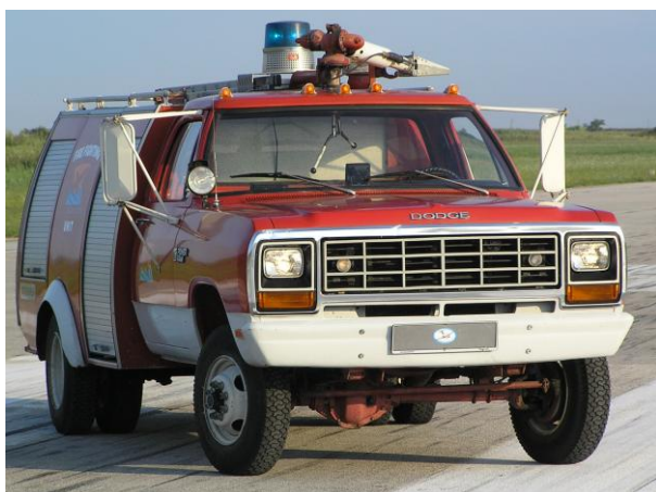
Slika 5: Manjše gasilsko vozilo za hitre intervencije DODGE W-450

Gasilsko vozilo DODGE W-450 je gasilsko vozilo za hitre intervencije, leto izdelave 1982 (slika 5). Poganja ga bencinski motor V8 z močjo 124,5 kW (170 KM). Ima avtomatski tristopenjski menjalnik in pogon na vsa štiri kolesa. Zagotavlja pospeške 80 km/h v 25 s in hitrostjo večjo od 105 km/h. Količina vode je 800 l vode ter 200 l penila.