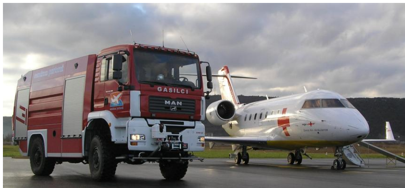
Slika 3: Gasilsko vozilo za hitre intervencije MAN TGA

Gasilsko vozilo MAN TGA 18.530 je gasilsko vozilo za hitre intervencije (slika 3). Vozilo ima motor s 395 kW (530 KM), avtomatski 12-stopenjski menjalnik in pogon na vsa štiri kolesa. Zagotavlja pospeške 80 km/h v 25 s in hitrostjo večjo od 105 km/h. Količina vode je 5.400 l ter 500 l penila.