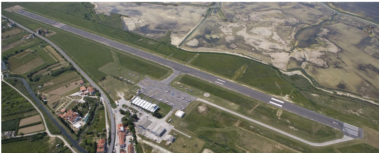
Slika 1: Letališče Portorož

Registrirano je kot javno letališče, odprto za domači in mednarodni potniški ter tovorni promet. Namenjeno je za prevoz potnikov in blaga ter za športne, šolske, turistične in poslovne polete. Celoten letališki kompleks z VPS (vzletno pristajalno stezo) je nepravilne pravokotne oblike dolžine približno 1.400 m in širine 130 do 450 m (slika 1).