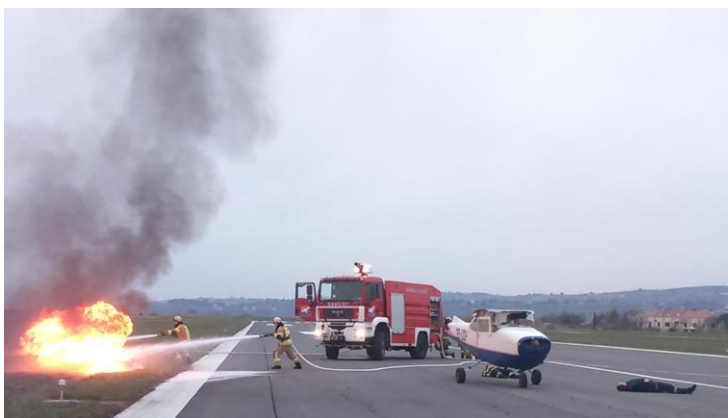
Slika 6: Letališka vaja s požarom manjšega letala

Del scenarija gasilske vaje marca 2016 je bil, da je na vzletno - pristajalni stezi portoroškega letališča zagorelo manjše enomotorno letalo Cessna-172 (slika 6). Aerodrom Portorož je organiziral gasilsko vajo, kjer so sodelovale tudi zunanje gasilsko-reševalne enote iz obalne regije - zaradi prenove komunikacijskega sistema in kompatibilnosti s poklicnimi ter prostovoljnimi gasilskimi enotami glede komuniciranja smo izvedli gasilsko vajo manjšega obsega.